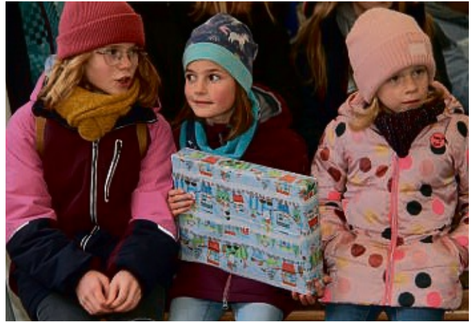
Strahlende Kinderaugen: Die gibt es jedes Jahr bei der Geschenkeverteilung der Aktion „Weihnachtswunschbaum“ – wie hier bei der Geschenke-Aktion im vergangenen Jahr.

Auch in diesem Jahr gibt es wieder die Aktion „Weihnachtswunschbaum“ der Frankenberger Kaufleute. Dabei lassen die heimischen Geschäftsleute wieder „Herzenswünsche“ der Kinder wahr werden. Diesmal nimmt der „Briefkasten“ am großen Weihnachtswunschbaum am Iller- und Monesplatz die Wunschzettel noch bis kommenden Montag, 1. Dezember, entgegen. Es sind also nur noch wenige Tage, um die Wünsche zu notieren und abzugeben. Es eilt also. Mit der Aktion „Weihnachtswunschbaum“ erfüllen die Frankenberger Kaufleute wieder besondere Wünsche der Kinder – „der Weihnachtswunschbaum ist die schönste Veranstaltung des Kaufmännischen Vereins“, sagt André Kreis, der Chef der heimischen Einzelhändler.