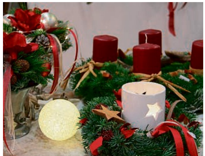
Feiner Markt: Mit seiner besonderen Atmosphäre wird der Weihnachtsmarkt „Advent im Klostergarten“ auch diesmal wieder die Besucher verzaubern.

35066 Frankenberg | Uferstraße 13 | Telefon 06451 7277-0 Telefax 06451 7277-99 | E-Mail: kanzlei@seidel-kollegen.de