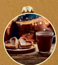
Köstliche Waffeln, Langos, Glühwein und Punsch