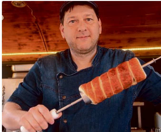
Street-Food-Festival: Das kulinarische Spektakel Anfang April wird wieder die Menschenmassen in die Frankenberger Innenstadt locken.

FREITAG, 7. JUNI, BIS DIENSTAG, 10. JUNI, FESTPLATZ WEHRWEIDE: Zu diesem beliebten Festtagswochenende werden wieder über 250 000 Besucher erwartet. Einer der vielen Anziehungspunkte für Menschen aus nah