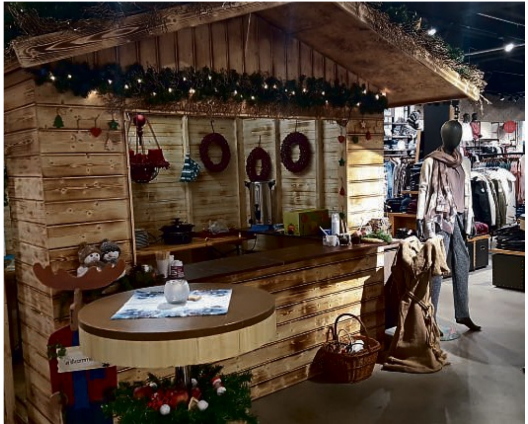
Im Modehaus Eitzenhöfer in der Bahnhofstraße und im „Home&Living“ in der Fußgängerzone wird am Samstag, 30. November, der Eitzenhöfer-Weihnachtsmarkt eröffnet.

Auf dem Weihnachtsmarkt vor und im Modehaus in der Bahnhofstraße sowie in der Home&Living Welt präsentiert Eitzenhöfer ein tolles Programm. Für die Kleinen gibt es im Modehaus von 11 bis 17 Uhr die schönsten Weihnachtsfilme, der Weihnachtsmann ist von 14 bis 17 Uhr ebenfalls im Modehaus unterwegs. Große Augen wird es für die Jungen und Mädchen geben, wenn sie sich zusammen mit dem Weihnachtsmann am Weihnachtschlitten fotografieren lassen dürfen. Das gibt tolle Erinnerungen an Weihnachten. Selbstverständlich gibt es im Modehaus auch das höchst beliebte Kinderschminken – und zwar von 12 bis 17 Uhr.