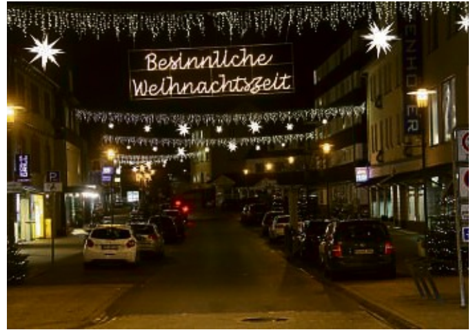
Die Frankenberger Kaufleute laden die Menschen in den nächsten Wochen in die herrlich weihnachtlich dekorierte Philipp-Soldan-Stadt ein.