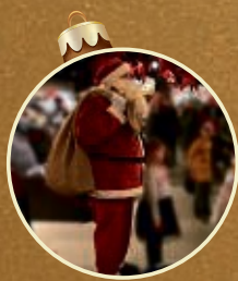
Unser Weihnachtsmann ist unterwegs