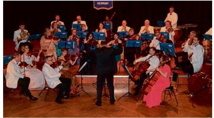
Die Musikerinnen und Musiker des Johann-Strauß-Orchesters Frankfurt gastieren nun bereits zum 16. Mal in Frankenberg.