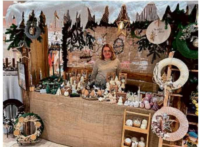
Alfredas ideenreiche Dekoartikel: Die gibt es an den beiden Wochenenden 29. und 30. November sowie 6. und 7. Dezember im Frankenerger Modehaus Heinze.

nelle Kränze für die Weihnachtszeit, Weihnachtsinspirationen aus Buchseiten, originelle Etageren aus Omas Geschirr, und, und, und...: Im Frankenerger Modehaus Heinze im Herzen der Fußgängerzone ist schon am Freitag und Samstag, 29. und 30. November, sowie am Freitag und Samstag, 6. und 7. Dezember, alles auf Weihnachten eingestimmt. Dann gibt es in dem Modehaus nicht nur viele Ideen, sondern auch allerlei köstliche Leckereien wie Marmela-